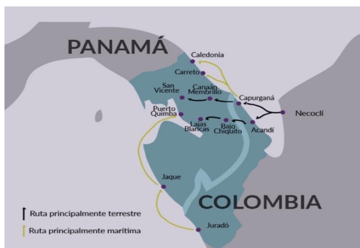
Figura 1. Rutas migratorias por Darién.