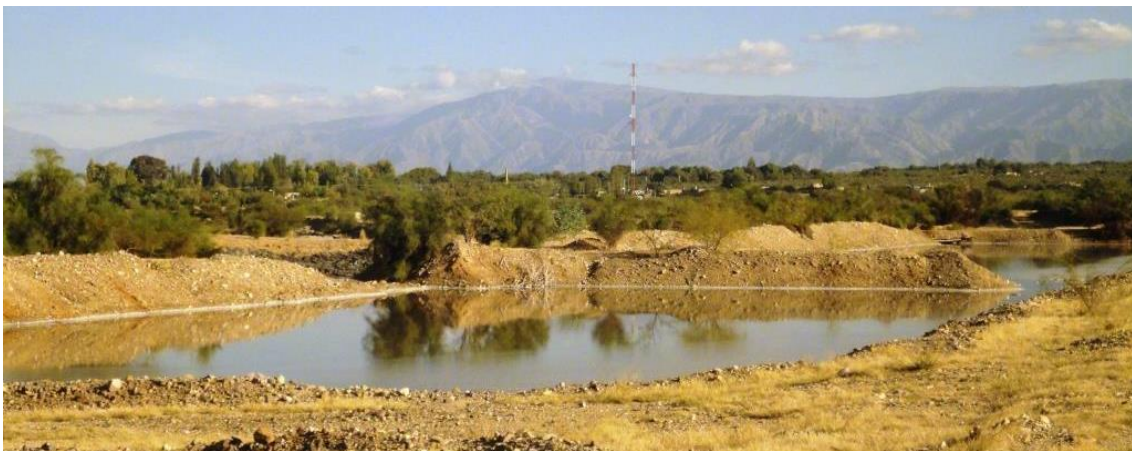
Imagen 4. Zona de los piletones cercana a las viviendas de Nonogasta

A pesar de la relativa “juventud” de la categoría de SA, el abordaje de la relación entre pobreza y medioambiente degradado puede retrotraerse a mediados del Siglo XIX, cuando Engels escribe sobre La situación de la Clase Obrera en Inglaterra (1979) y donde este filósofo alemán y colaborador de Marx aborda las malas condiciones ambientales en