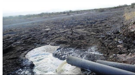
Imagen 2. Cañería de salida de los efluentes a cielo abierto

El pacto de silencio en Nonogasta se teje sobre una trama compleja de relaciones entre actores con diferente y desiguales cuotas de capital económico, político, cultural y también simbólico (BOURDIEU y WACQUANT, 2005; GUERRA MANZO, 2010). De manera clara, el campo de mayor disputa entre estos actores está en los efectos (en la salud humana y entorno natural) que tienen las sustancias químicas que descarga la curtiembre en forma de efluentes industriales (ver imagen 2 y 3). En reiteradas ocasiones se escuchan expresiones como: “la contaminación no es nociva para la salud”; “el cromo que se utiliza no es peligroso”; “el aire pestilente es molesto pero no dañino” (Diario de Chilecito 28 de agosto 2014); o “la contaminación enferma”; “la contaminación mata” (Diario de Chilecito 21 de abril 2014).