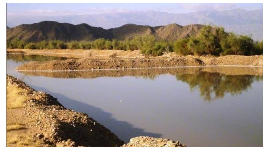
Imagen 3. Piletones de la Curtiembre de Nonogasta

En este campo de disputa se cruzan los actores con sus discursos, acciones y representaciones que buscan imponer por medio de estrategias como la negación del problema que hacen los gerentes de la curtiembre y su personal técnico, apoyados en “supuestos” informes de impacto ambiental de la Consultora Cado Fernández Tamazi (Diario de Chilecito, 28 de agosto 2014). Cabe señalar que esos informes no están disponibles al público, ni en la empresa, ni en la Secretaría de Ambiente de la Provincia de La Rioja.